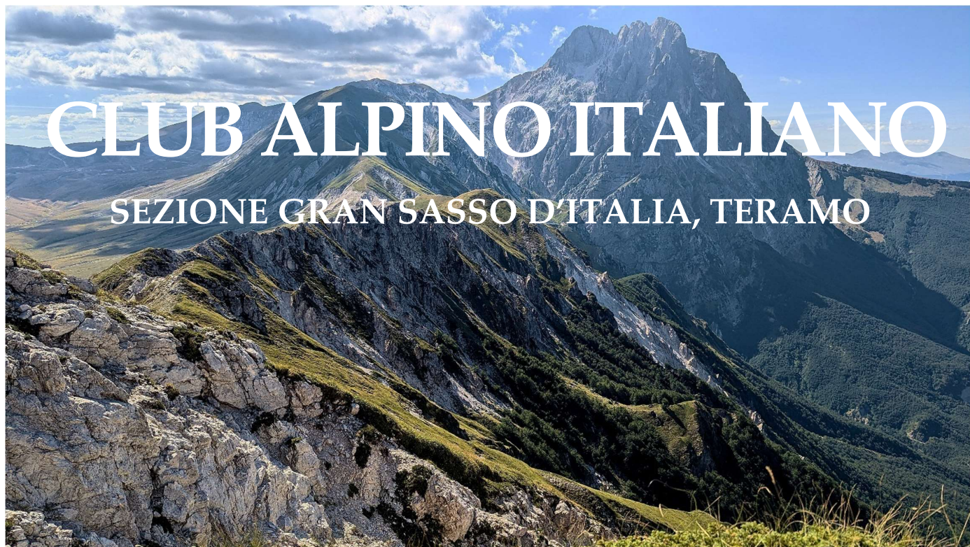
Corno Grande dal centenario, Foto: Niels van Bemmelen