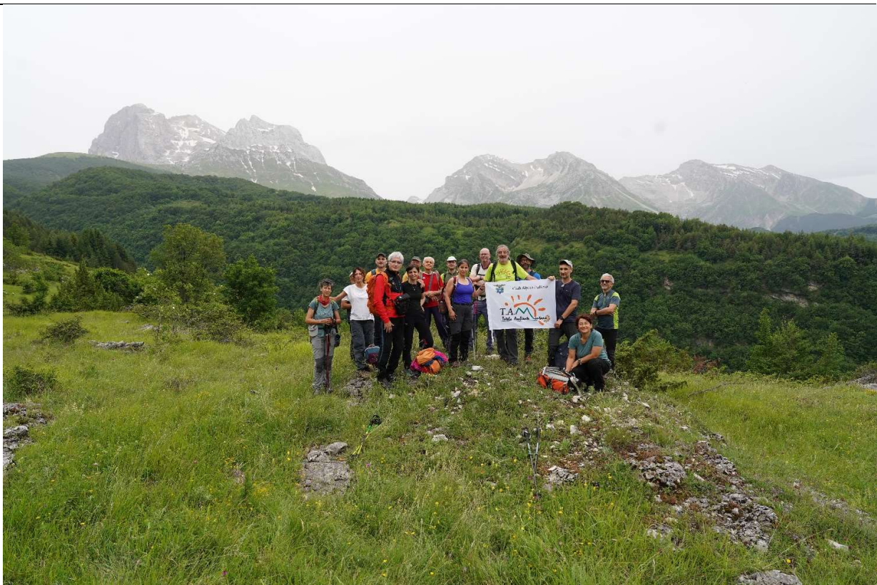
"In Cammino nei Parchi" nel territorio del Montagnone, 9 giugno 2024.