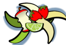
non abbandonare rifiuti